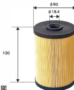
エレメント参考図