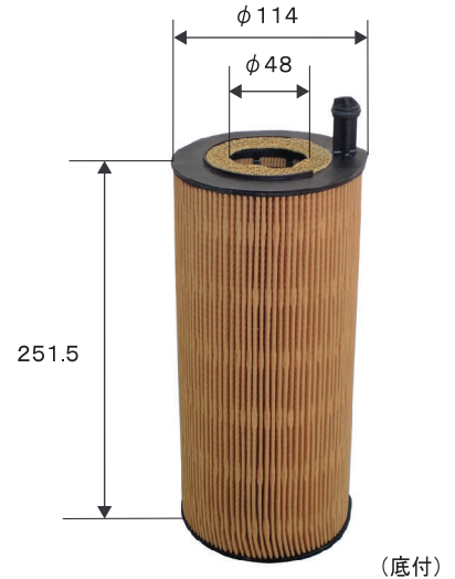
エレメント参考図