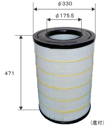
エレメント参考図